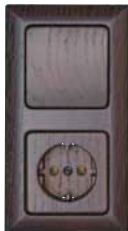
WENGE - TMAVÉ DREVO