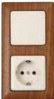
ORECH / BIELA